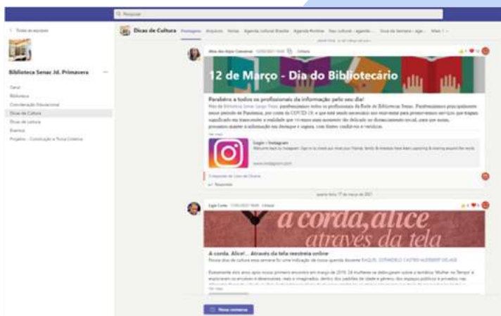
Espaço Virtual da Biblioteca Senac Jardim Primavera no Microsoft Teams

O objetivo interativo do espaço virtual foi permitir que a biblioteca continuasse como um organismo vivo, de caráter colaborativo. A construção desse espaço foi em parceria com alunos, professores e demais pessoas da comunidade escolar, como representantes dos comitês de Cultura de Paz, CIPA e Inclusão e Diversidade.