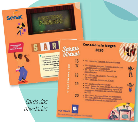
Cards das atividades