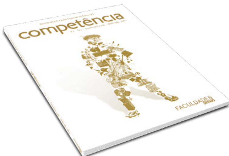
Figura 1 – Capa da primeira edição da Competência – dezembro de 2007

[...] o projeto gráfico editorial torna-se fundamental, pois é por meio dele que uma publicação pode apresentar dados organizadamente e contribuir para a disseminação da informação e para a construção do conhecimento (PASSOS; PASSOS, 2013, p. 160).